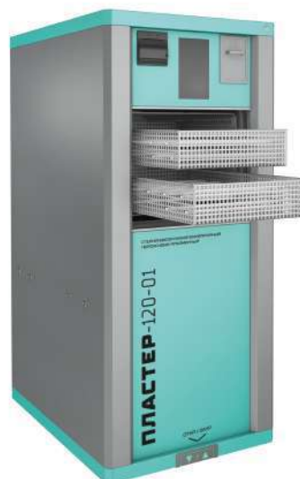
Пластер-120-01-Мед ТеКо Пластер-120П-01-Мед ТеКо