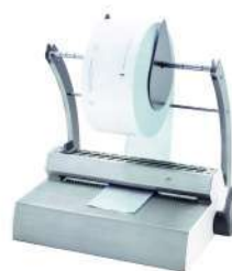
Режущее устройство с держателем рулонов