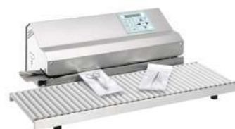
Автоматическая машина для запечатывания