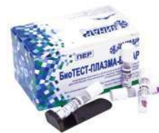
Биологические и химические индикаторы