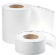
Упаковочные рулоны (Tyvek)