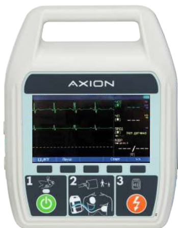
Дефибриллятор ДА-Н-02 с функцией ручной и автоматической наружной дефибрилляции.