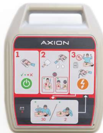
Дефибриллятор ДА-Н-05 с функцией автоматической наружной дефибрилляции.